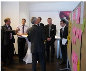
Impressionen ID-Consult-Managementkonferenz 2012

Marktplatz: Erfahrungsaustausch über Themen Ihrer Wahl